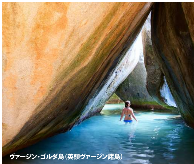
ヴァージン・ゴルダ島(英領ヴァージン諸島)