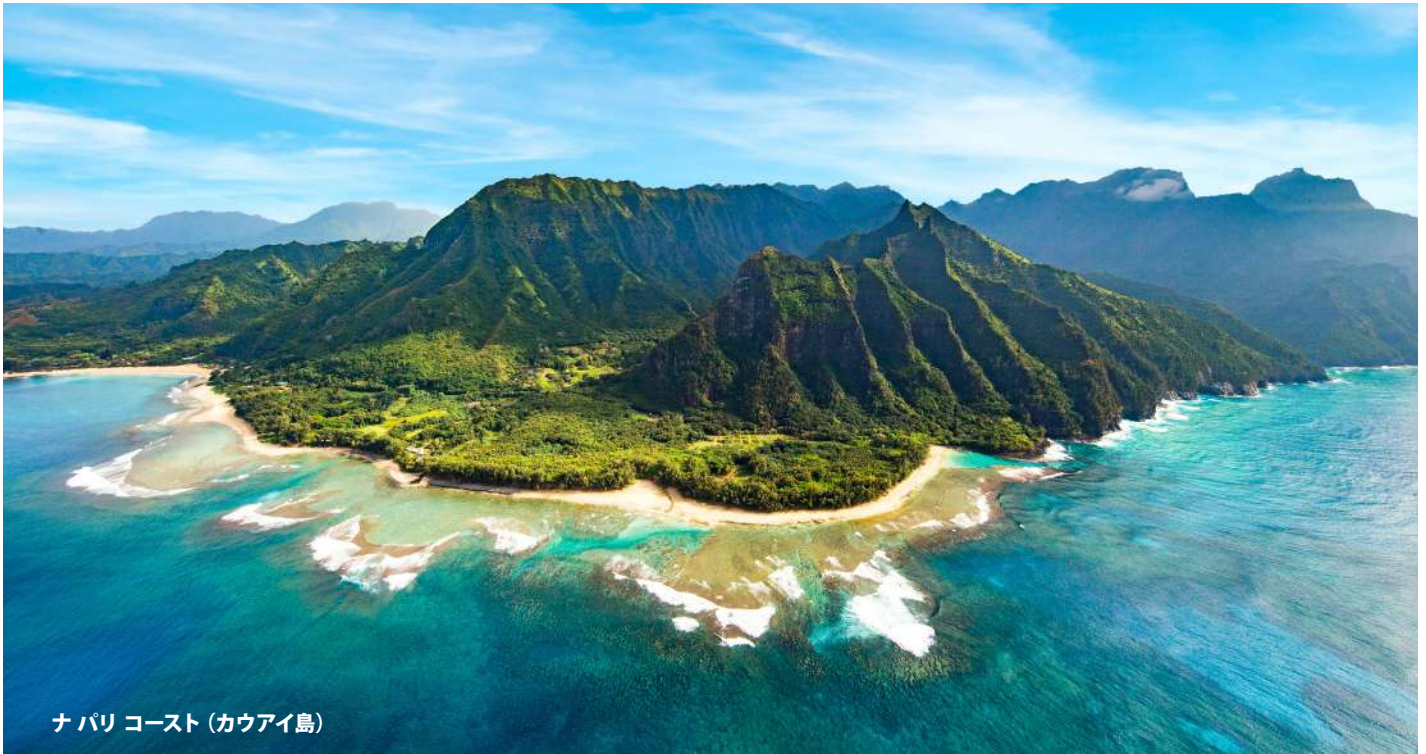
ナパリ コースト (カウアイ島)