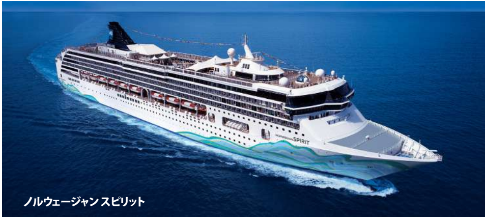
ノルウェーجانスピリット

航程を選択したら、あとは極上の客船に乗って ハワイと南太平洋で過ごす完璧なバケーションをお楽しみください。