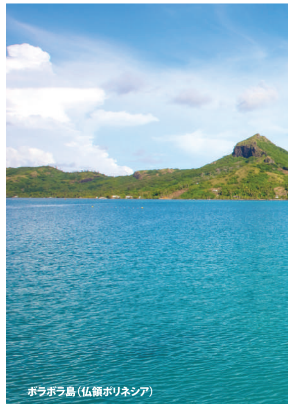
ボラボラ島 (仏領ポリネシア)