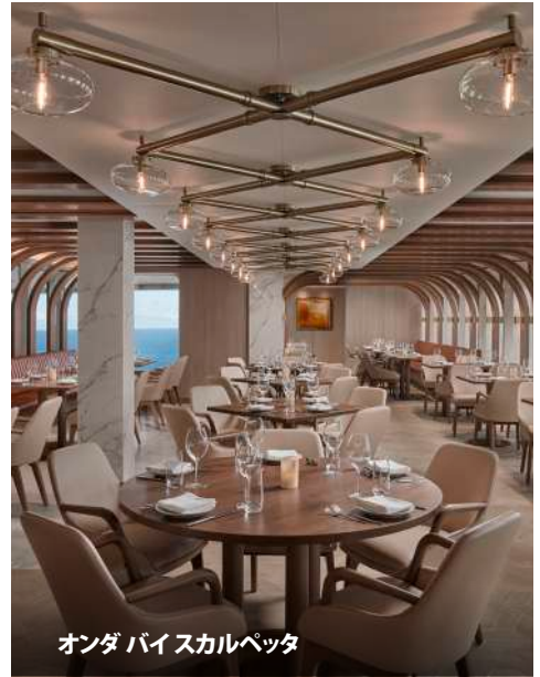
オンダ バイスカルベッタ