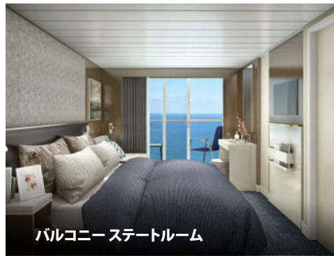
バルコニー ステートルーム