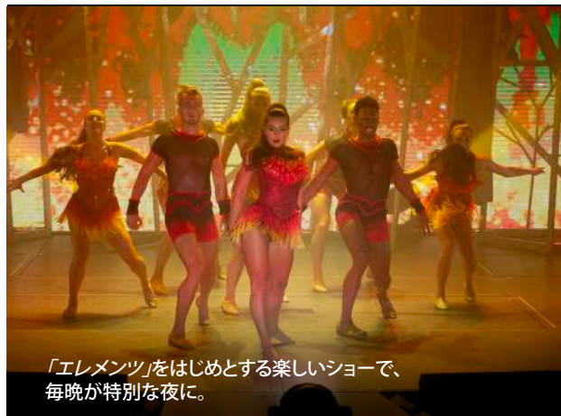
「エレメンツ」をはじめとする楽しいショーで、毎晩が特別な夜に。