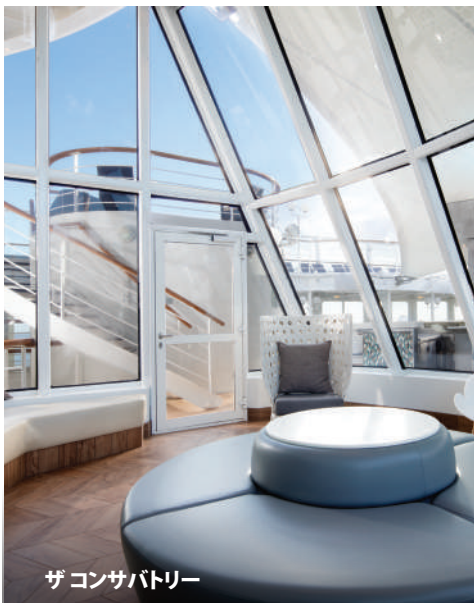
ザコンサバトリー