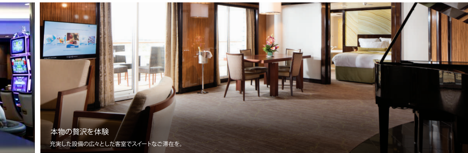
本物の贅沢を体験