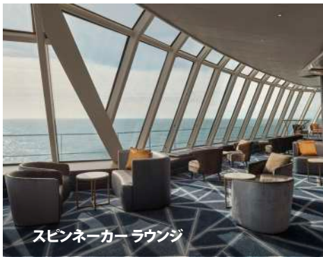
スピナーカー ラウンジ

改装:2020年・建造:1998年・乗組員数:912人 総トン数:75,904トン 乗客定員数(2人部屋):2,018人 全長:880フィート・全幅:121フィート