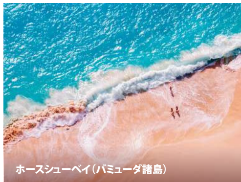
ホースシューベイ(バミューダ諸島)