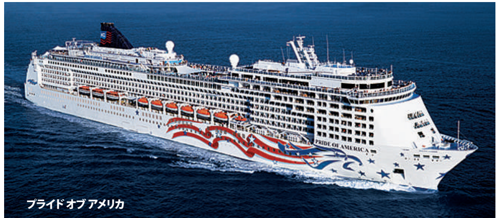
プライドオブアメリカ

改装:2021年・建造:2005年・乗組員数:927人 総トン数:80,439トン 乗客定員数(2人部屋):2,186人 全長:920フィート・全幅:119フィート