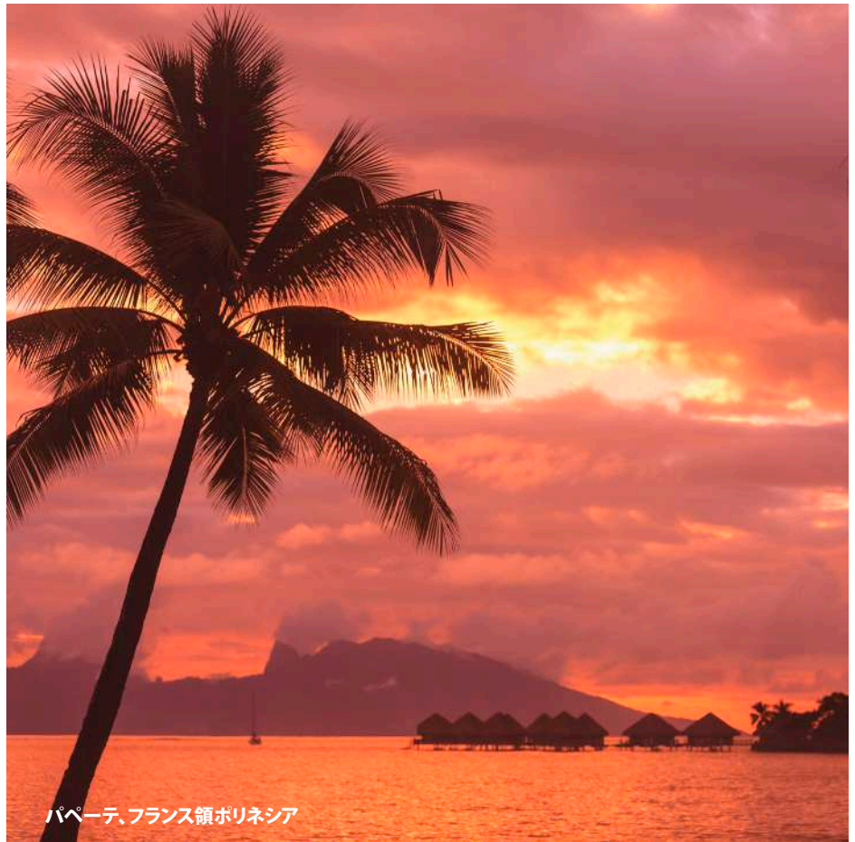
パペーテ、フランス領ポリネシア