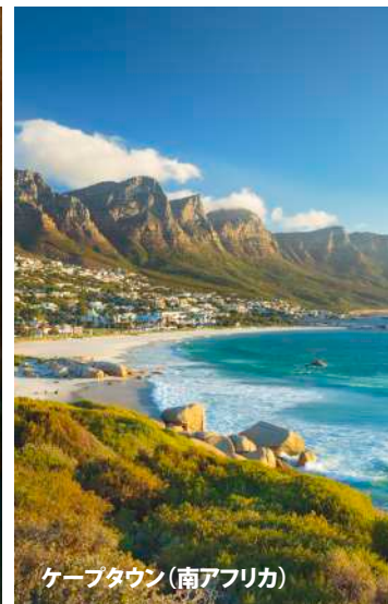
ケープタウン(南アフリカ)