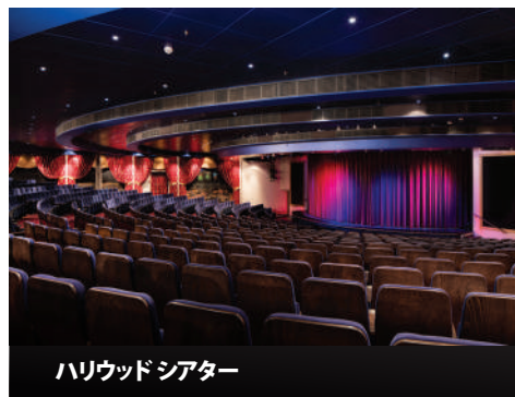
ハリウッドシアター