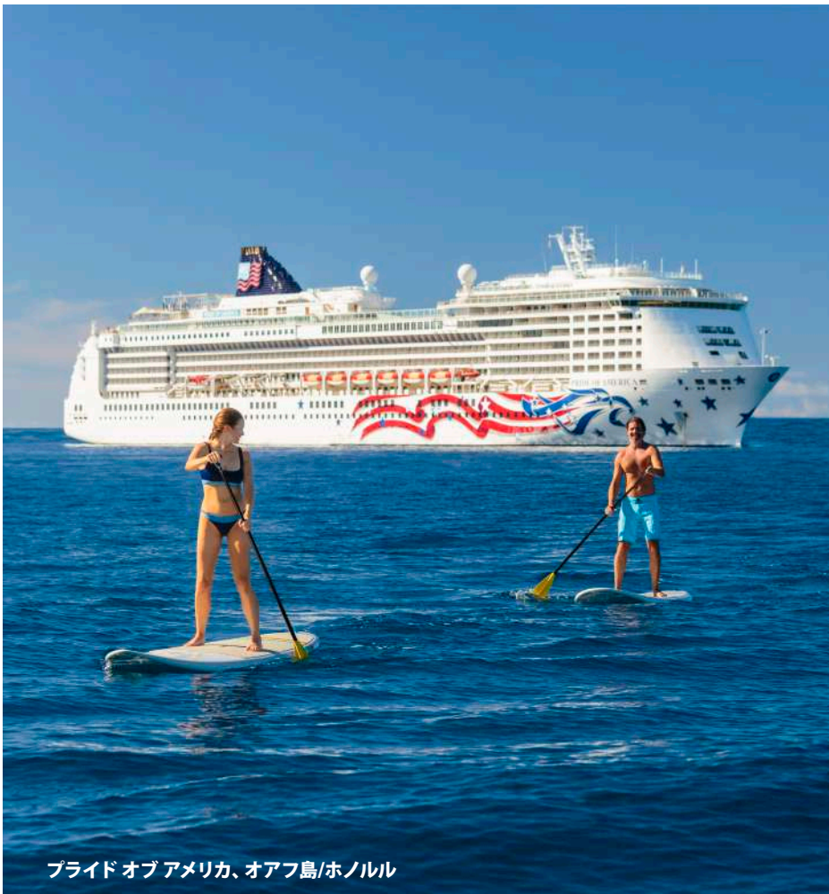
プライド オブ アメリカ、オアフ島/ホノルル