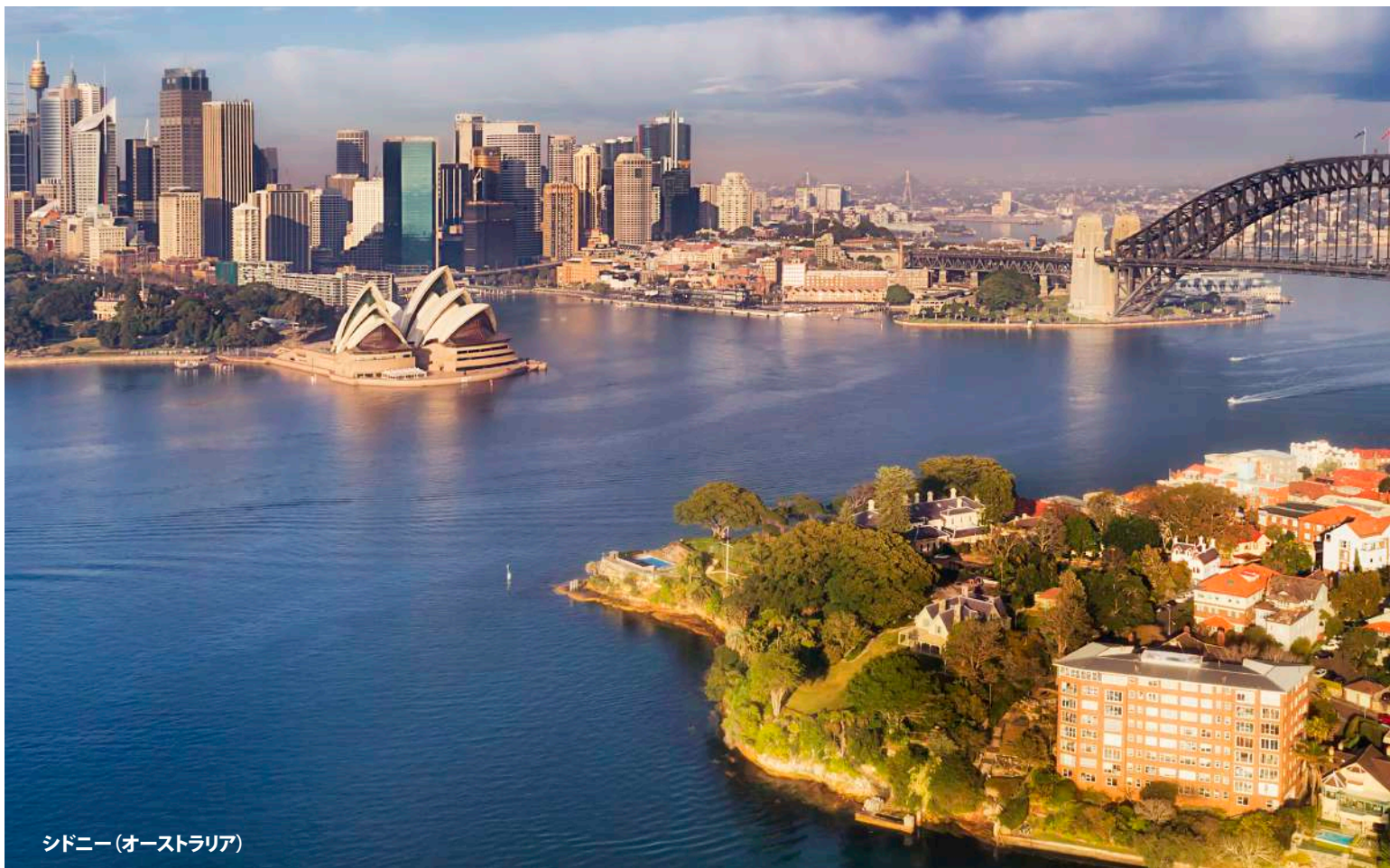
シドニー (オーストラリア)