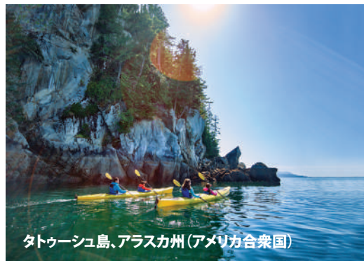
タトゥーシュ島、アラスカ州(アメリカ合衆国)