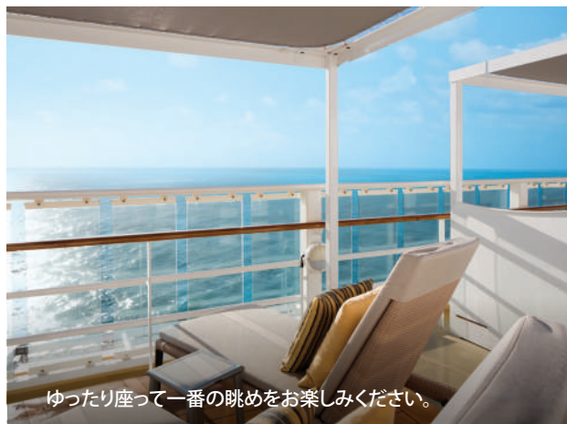
ゆったり座って一番の眺めをお楽しみください。