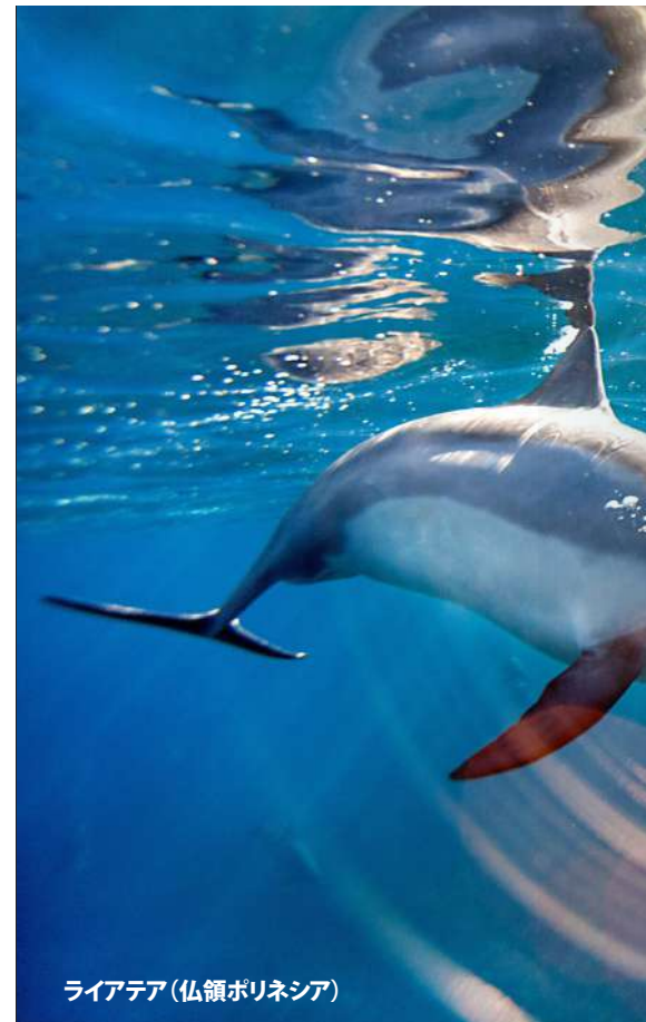
ライアテア(仏領ポリネシア)