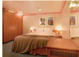
2名1室利用イメージ