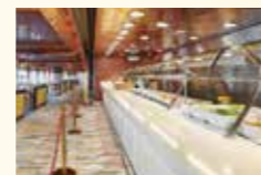
ビュッフェコーナー お好きな時間に自由に気軽に食事が出ます。