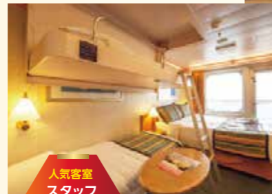
人気客室 スタッフ オススメ