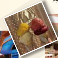
ジェアテリアアマリーノ (ジェラート・有料)