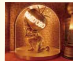
ピッツェリア プミドーロ (ピザ・有料)