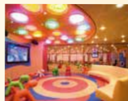
スクウォッククラブ ファミリーにうれしいキッズプログラム (0-2歳のお子様は保護者同伴必須)