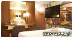
コスタ スメラルダ