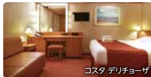
コスタ デリチオーザ