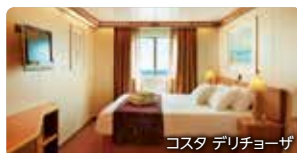
コスタ デリチオーザ