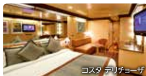
コスタ デリチオーザ