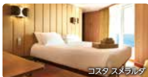
コスタ スメラルダ