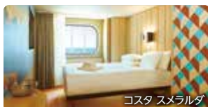
コスタ スメラルダ