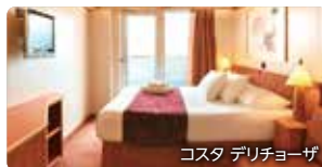
コスタ デリチオーザ