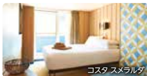
コスタ スメラルダ