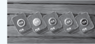
キャプテンズ・サークルのランクに応じて、「メダリオン」の色が5段階に分かれます。

プリンセス・クルーズに一度ご乗船いただくと、次回からリピーターとして様々な特典が受けられる「キャプテンズ・サークル」のメンバーにお迎えします。ご乗船回数・日数に応じて各種特典をご用意しています。