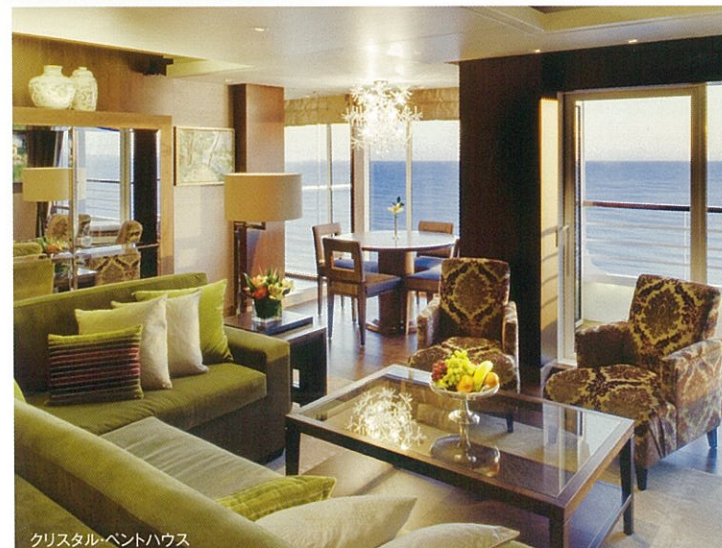
クリスタル・ベントハウス