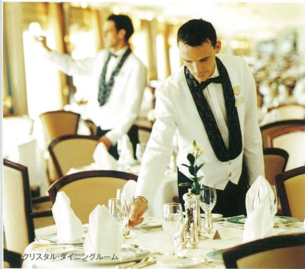
クリスタルダイニングルーム