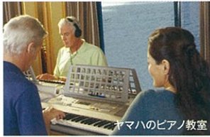
ヤマハのピアノ教室