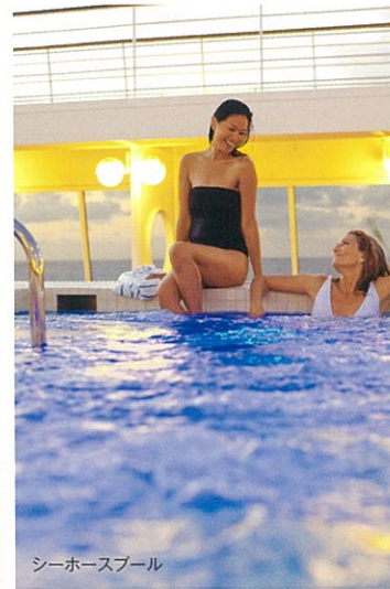
シーホースプール