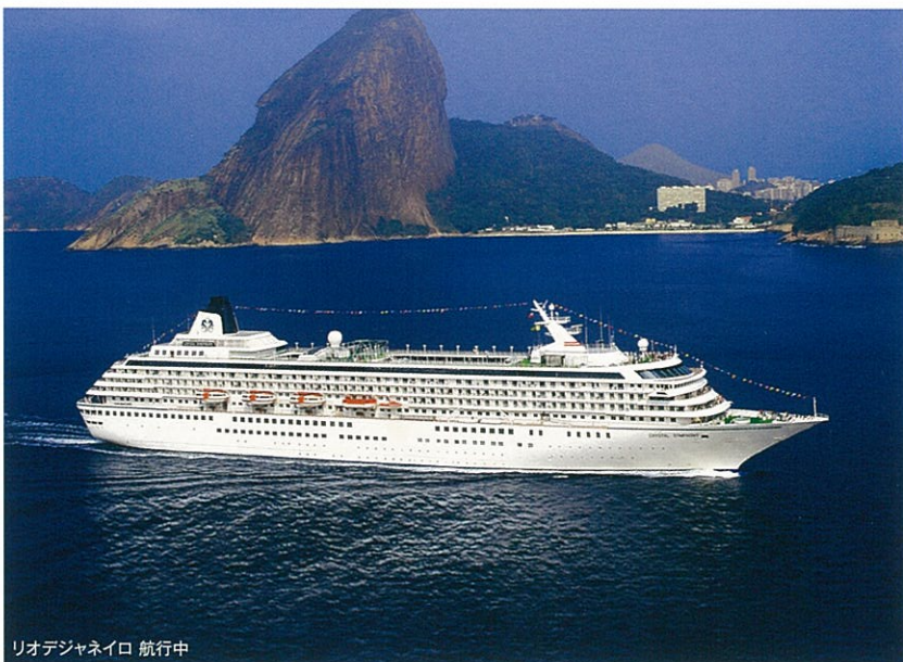
リオデジャネイロ 航行中