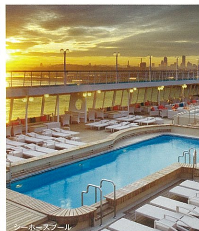
シーホースプール