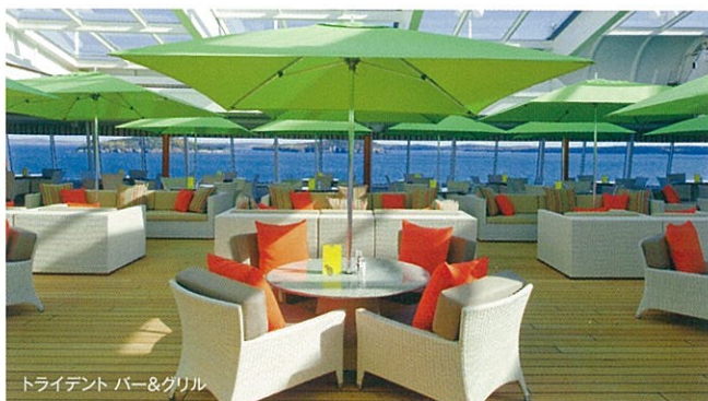
トライデント バー&グリル