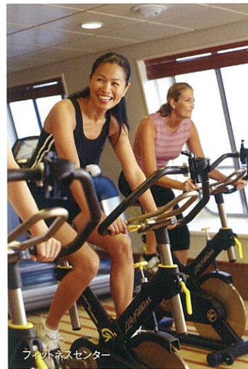
フィットネスセンター