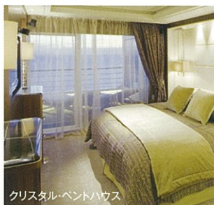
クリスタル・ベントハウス