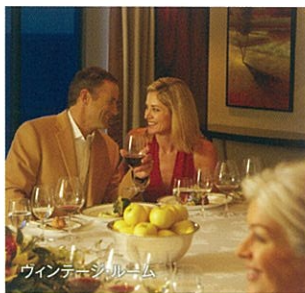
ワインテラスルーム