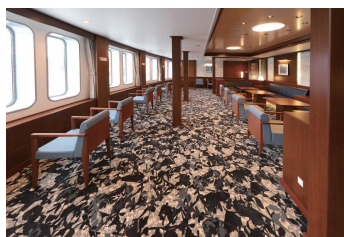
フォワードサロン