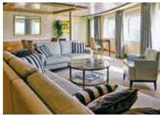
シングルチェアスイート 87.0㎡ [ベランダ 55.7㎡]