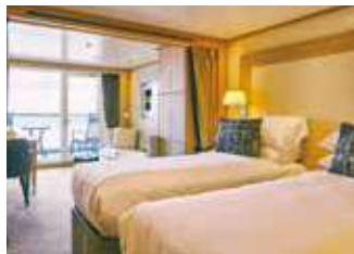
ベランダスイート [A~F] 24.4~30.2㎡ [ベランダ 3.1~6.2㎡]