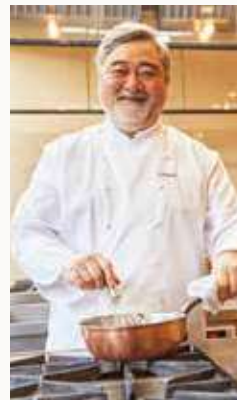
北斎 FINE DINING スーパーバイザー 三國 清三シェフ

1954年、北海道生まれ。1974年、駐スイス日本大使館の料理長に就任。その後も三つ星レストランで修業を重ねる。1985年、東京・四ツ谷に「オテル・ドゥ・ミクニ」を開店。2015年、フランスよりレジオン・ドヌール勲章シュヴァリエを日本の料理人で初めて受勲。2025年、カウンターのみのレストラン「三國」を開店。現在、子どもの食育活動や、手軽なレシピをYouTubeで発信している。