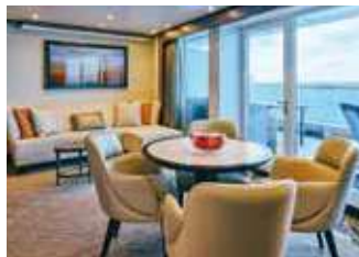
ペントハウススパスイート 48.8~49.4㎡ [ベランダ 15.6~18.2㎡]