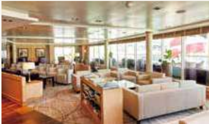
MITSUI OCEAN スクエア