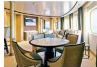
ラグジュアリースイート [A・B] 55.7~87.0㎡ [ベランダ 8.8~36.1㎡]