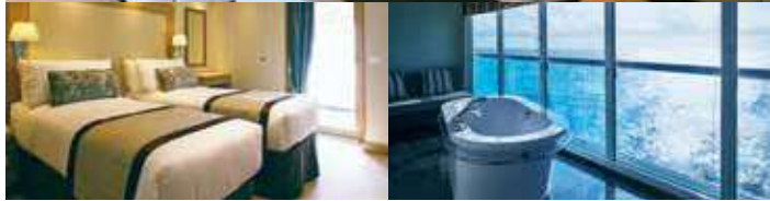
MITSUI OCEAN スイート 82.4㎡ [ベランダ 16.8㎡]