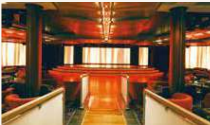
オーシャンステージ