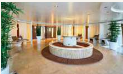
スパ&ウェルネス木霊