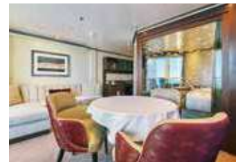
ペントハウススイート 39.7~54.8㎡ [ベランダ 8.0~14.0㎡]