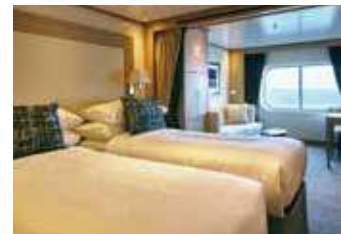
オーシャンビュースイート 25.3~29.4㎡ ※ベランダはありません。