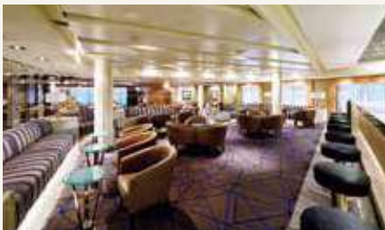
オーシャンクラブ&バー