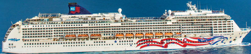
プライド・オブ・アメリカ号

7日間ハワイ島周遊旅行 ホノルル発 プライド・オブ・アメリカ号 2022年1月から毎週土曜日出港