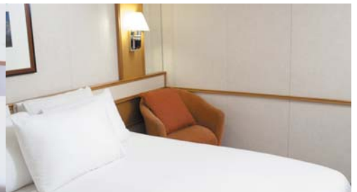
インサイド/インサイド・スーパーリア 10㎡/部屋数:316室