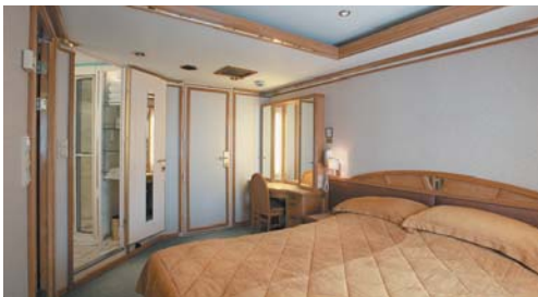
ロイヤルスイート(バルコニー付) 55㎡/部屋数:1室