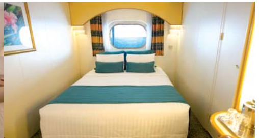
アウトサイド/アウトサイド・スーパー 11㎡/部屋数:423室