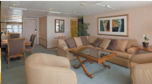
ロイヤルスイート(バルコニー付) 62㎡/部屋数:1室