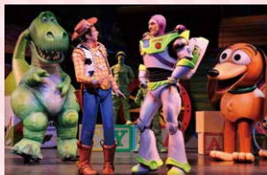
Inspired by the Disney, Pixar film "Toy Story" ©Disney/Pixar