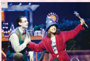
▲ディズニー・ヒーロー トイ・ストーリー▼