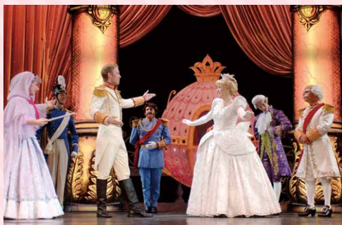
▲トウワイス チャームド

クルーズのために用意されたディズニー新作ミュージカルは、船上でしか観ることができない貴重なショーです。