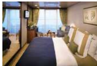
クラブベランダ客室