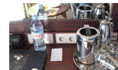
無料の水と飲料水

有料の飲み物やスナックが入っています。ご希望に応じてご利用ください。料金は SeaPass に課金されます。またデスクに無料の水とミネラルウォーターをご用意しており、毎日お取替えします。