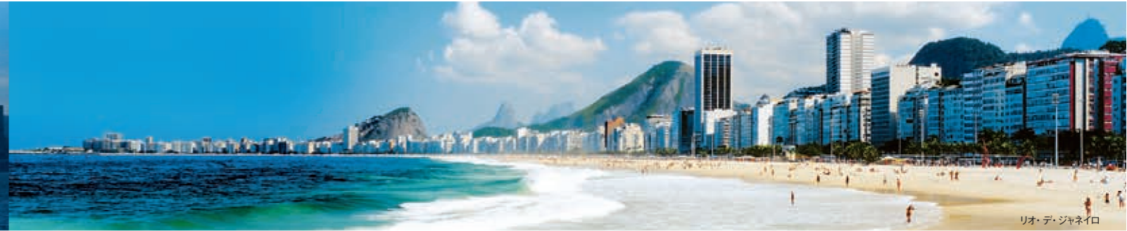
リオ・デ・ジャネイロ