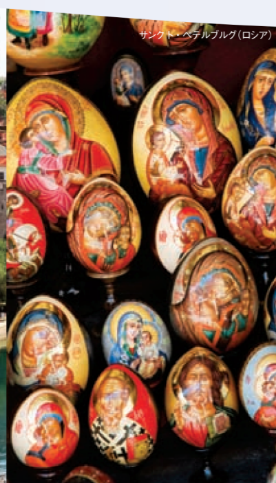
サンクト・ペテルブルグ(ロシア)