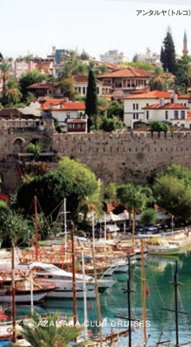
アンタルヤ(トルコ)