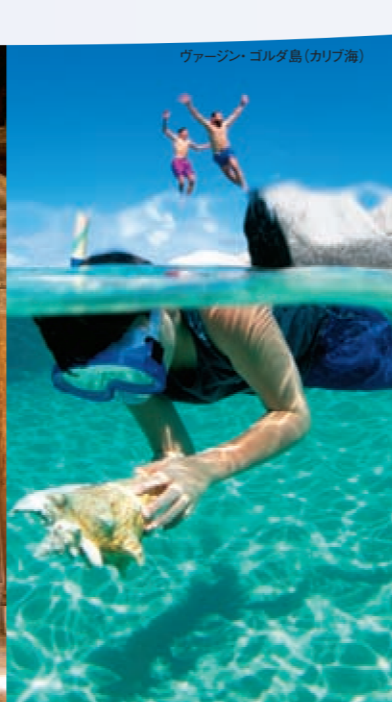
ヴァージン・ゴルド島(カリブ海)