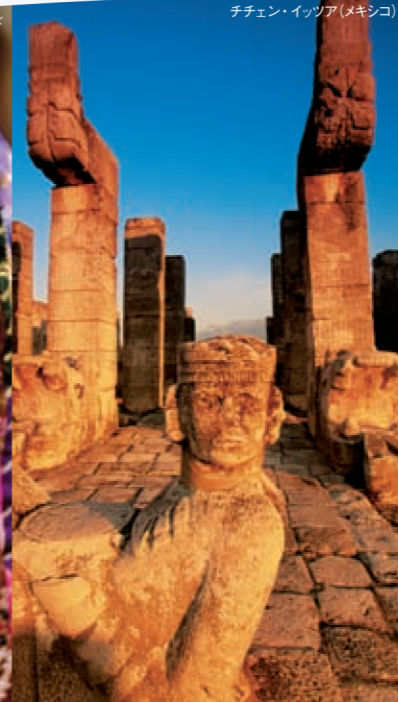
チチェン・イツツァ(メキシコ)