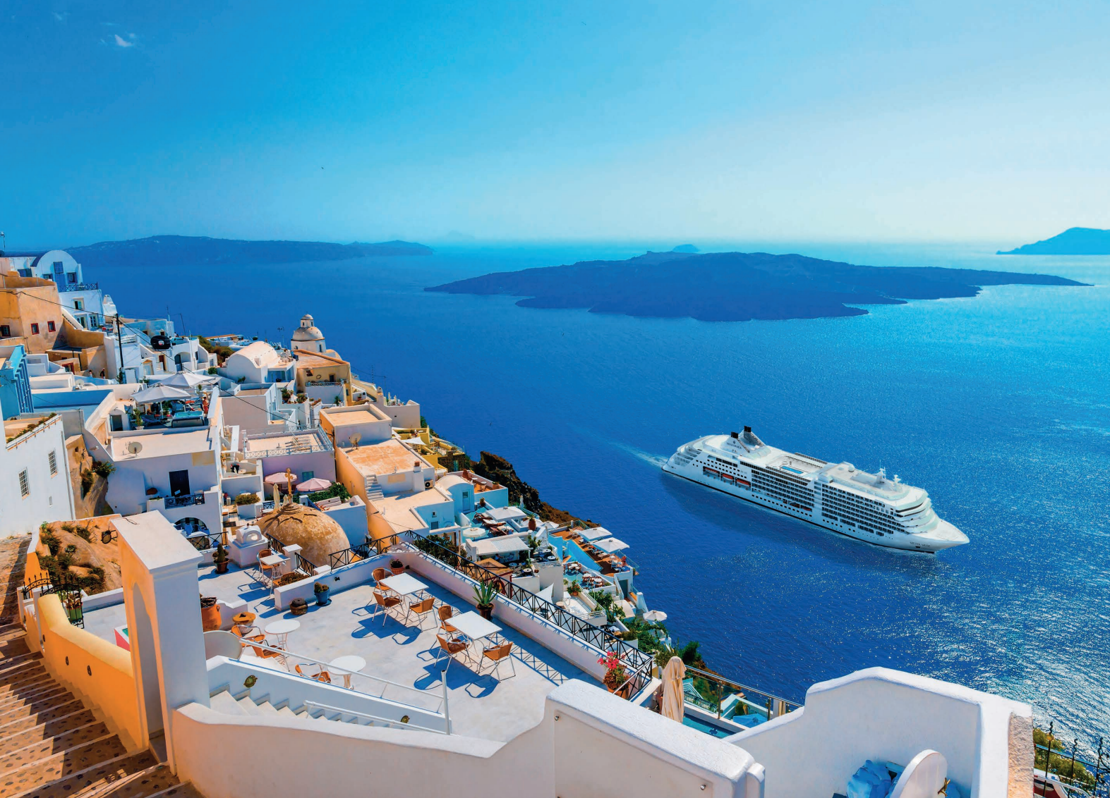
2017年4月就航 シルバー・ミュージズ