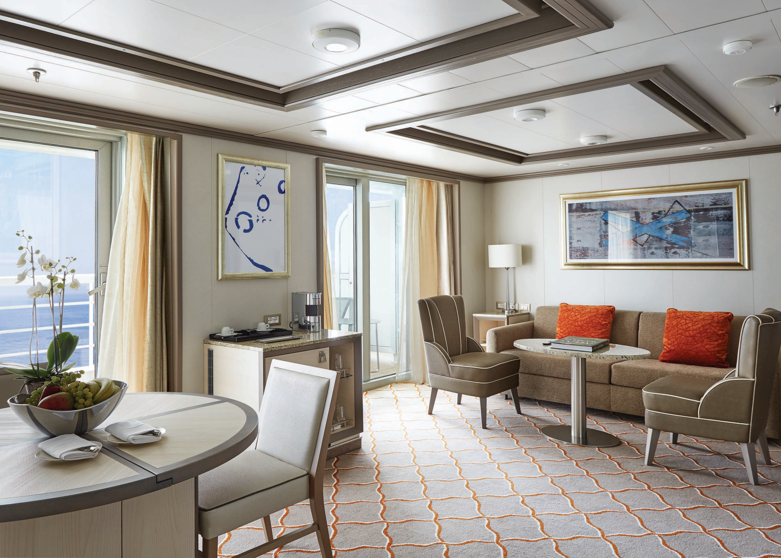
シルバー・スイート シルバー・ミュージズ