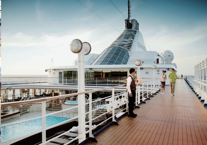
パノラマラウンジデッキ/ザ・スパ・アット・シルバーシー プールバー/ジョギングトラック