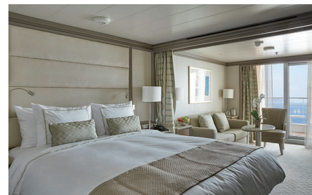
ベランダ・スイート シルバー・ミュージズ

▪ ロイヤル・スイート、グランド・スイート、オーナーズ・スイートにお泊まりのお客様には別途特典がございます。