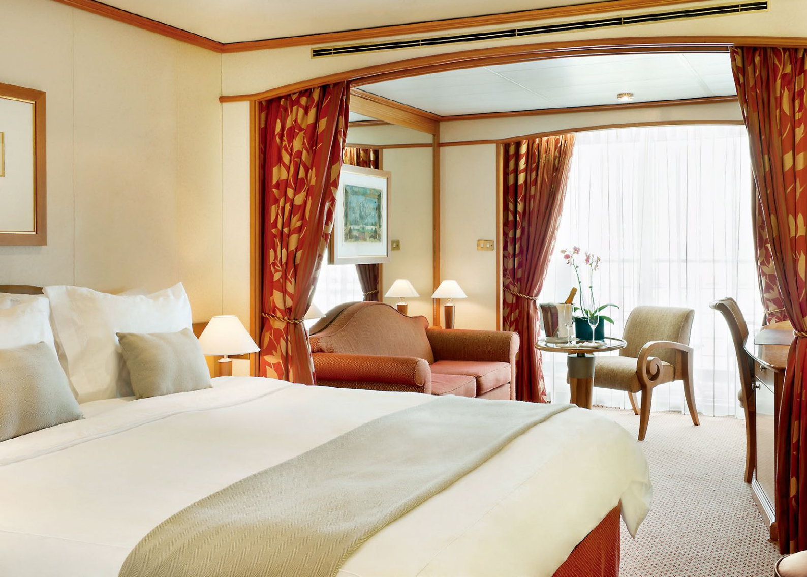
ベランダ・スイート シルバー・シャドー/ウィスパー