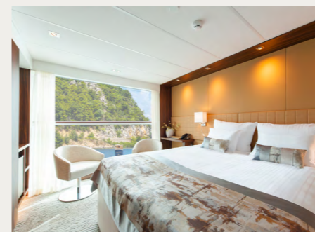
ステートルーム(アマデウス・クイーン)