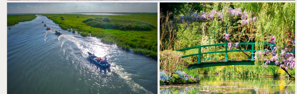
ドナウデルタ(イメージ)