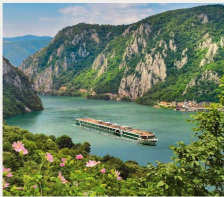
アマデウス・スター