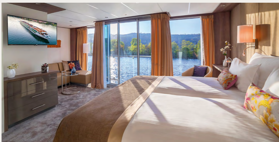
アマデウススイート(アマデウス・プロヴァンス)