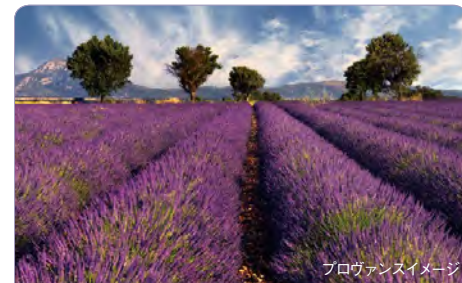
プロヴァンスイメージ