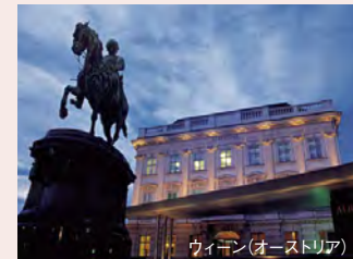
ウィーン(オーストリア)

人々が街に繰り出し、時計台が新年の0時を知らせるのを待つ中、アマデウスの船のサンデッキから街のまばゆい光を眺め、伝統的なドナウワルツを踊りながら新年を迎えます。ルフトナー・クルーズから優雅に新たな一年がはじまります。