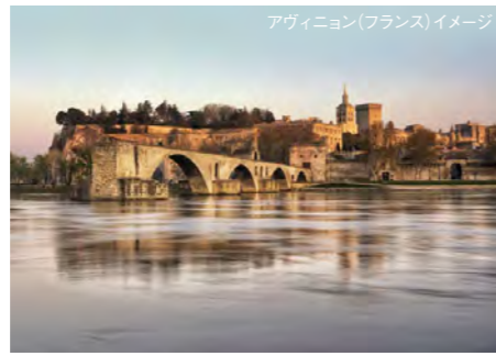
アヴィニョン(フランス) イメージ