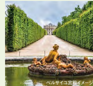
ベルサイユ宮殿イメージ

花の都パリを発着地とするクルーズ。印象派絵画の巨匠、ゴッホ、セザンヌ、そしてゴーギャンらの軌跡をパリからセーヌ川下流のルーアン、続いてノルマンディー地方のコドゥベック＝アン＝コーへと辿ります。第二次大戦中のノルマンディー上陸作戦で有名なビーチを訪れるエクスカーションもご紹介します。