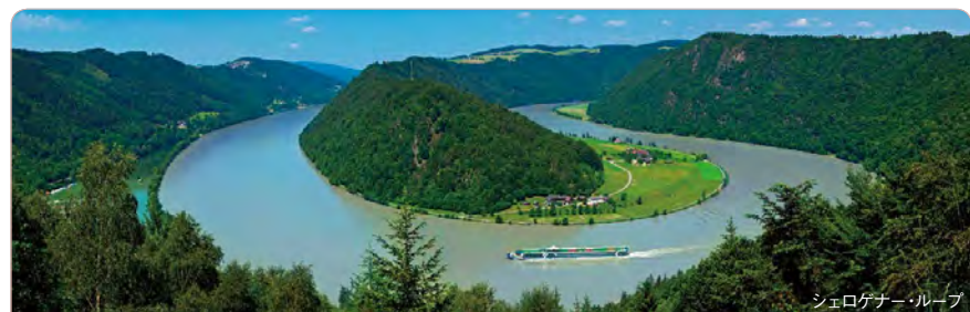
シェロケナー・ループ