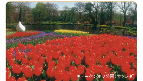
キューケンホフ公園(オランダ)