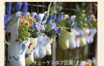
キューケンホフ公園(オランダ)

アムステルダム、ゲント、アントワープなど、絵画のように美しい場所を訪れるクルーズです。特殊な水路に沿って、世界で最も美しいとされる壮大なチューリップ畑や有名な園芸を訪問します。オランダの南部に位置するキューケンホフ公園は、ヨーロッパ最大の花園で、春には世界でいちばん美しいと言われる「ヨーロッパの庭園」です。チューリップや水仙、ヒヤシンスなど700万本以上の花が咲き誇る、この時期にしか見ることのできない景観をぜひご覧ください。