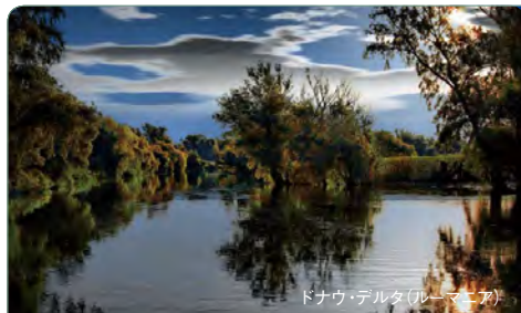
ドナウ・デルタ(ルーマニア)