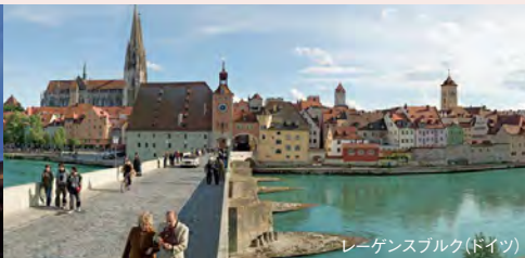
レーゲンスブルク(ドイツ)