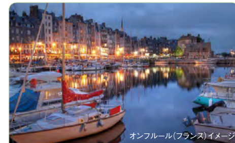
オンフルール(フランス)イメージ