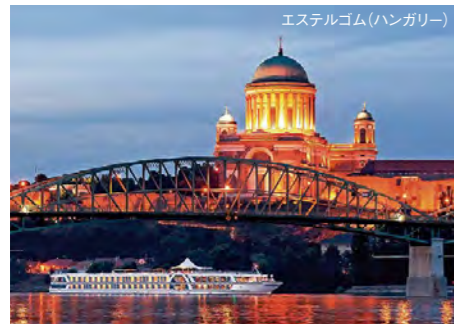
エステルゴム(ハンガリー)

快適で上質なサービスに満たされた休日を、 ルフトナー・クルーズ、アマデウスの船でお過ごしください。 すべてのキャビンは窓付きで、24時間ゆったりと風景を望めます。