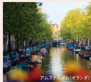
アムステルダム(オランダ)

「北のベネチア」と呼ばれる運河の街アムステルダムから、ライン、ライン、ドナウ川をくぐり、ハンガリーの荘厳な首都ブダペストまで、ヨーロッパ5ヶ国の魅力的な都市を巡るコースです。世界遺産である中部ライン渓谷ではローレライロックや古城、ブドウ畑が織りなす美しい風景に目を奪われます。また3つの川の合流地点であるパッサウや、ヴァッハウ渓谷、ウィーン、ブラチスラヴァなど、魅力的な街を巡ります。