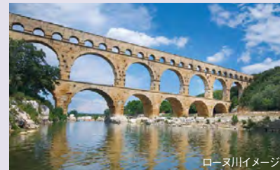
ローヌ川イメージ

色鮮やかな南フランスのブルゴーニュ地方やプロヴァンス、カマルグをめぐるクルーズです。ローヌ川、ソヌ川をゆくこのクルーズではフランス流の人生の楽しみ方や素晴らしい景色を堪能していただけます。美食の街リヨンから始まりリヨンで終わるクルーズでは、ブドウ畑を通りながらメイコンやワインで有名なボジョレーを巡ります。また教皇宮殿が有名なアヴィニオンやカマルグの自然保護区、アルデシュの渓谷などが見どころです。