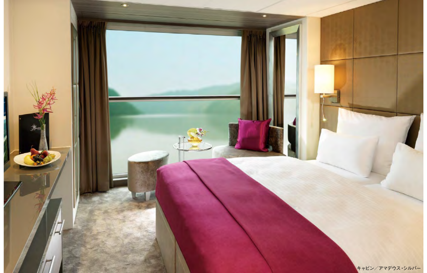
キャビン/アマデウス・シルバー

オランダ・ベルギーの川や運河をはじめ、 壮大なライン川、メイン川、モーゼル川、セーヌ川、ローヌ川、ソーヌ川、 ドナウ川をめぐるクルーズをご用意しております。