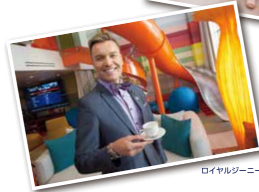
ロイヤルジュニー