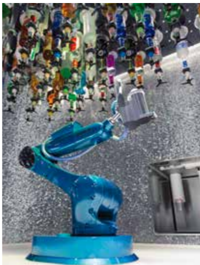
バイオニックバー(ロボットバー)