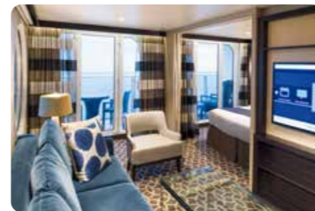
グランドスイート