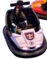
シープレックス&バンパーカー