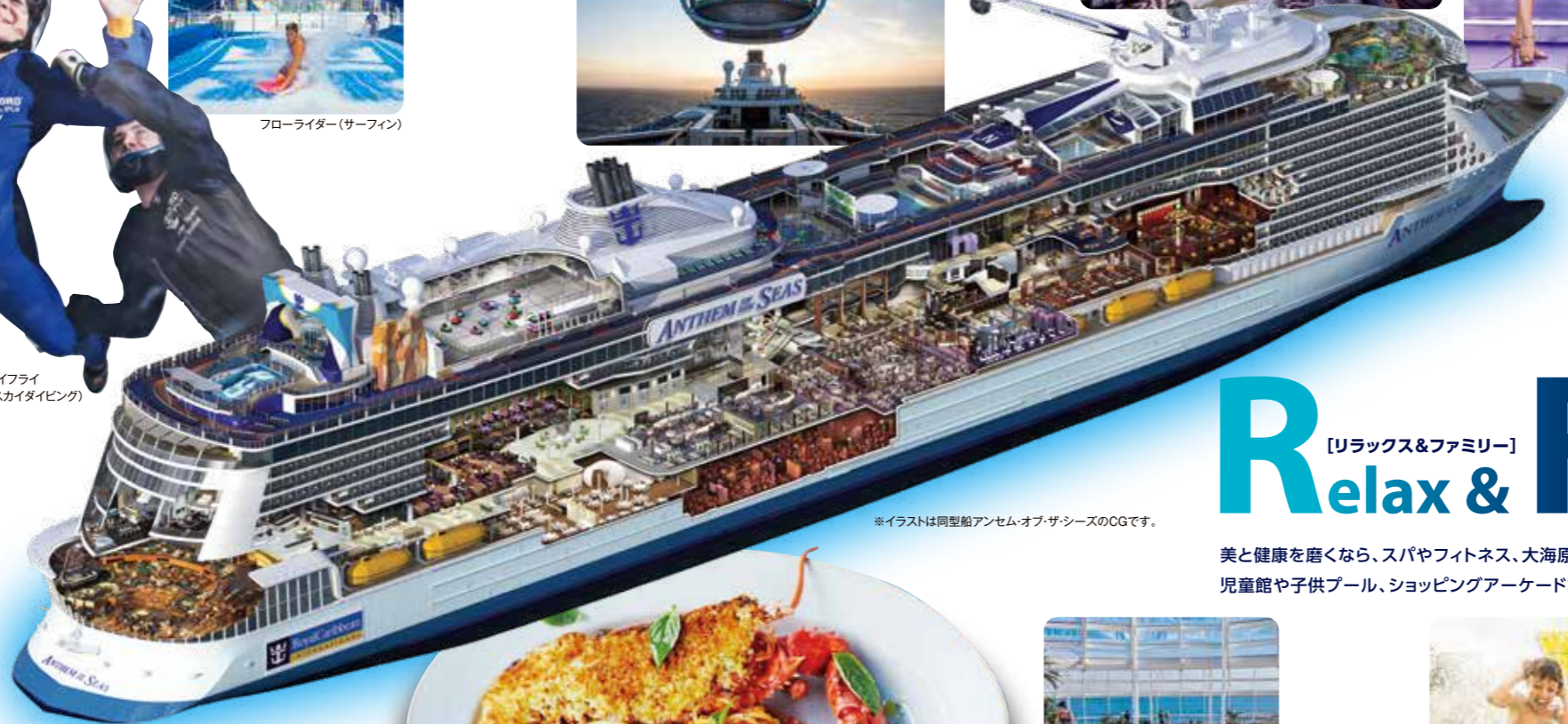
*イラストは同型船アンセム・オブ・ザ・シースのCGです。