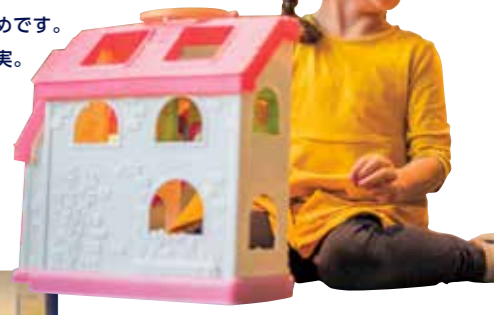
アドベンチャーオーシャン(児童館)