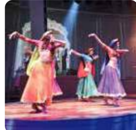
トゥセブンティショー(シルクロード)