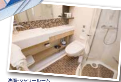
洗面・シャワールーム