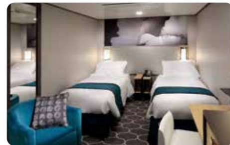
スタンダード内側