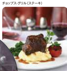
チョップス・グリル(ステーキ)