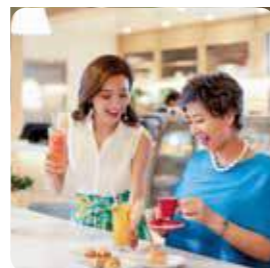
リーフ&ビーン(お茶専門店)