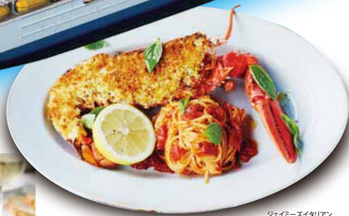
ジェイミーズイタリアン