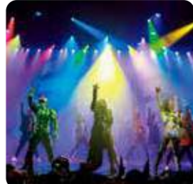
シアターショー(エフェクターズ)