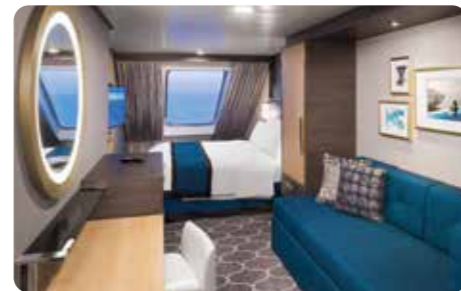
スーパーリア海側