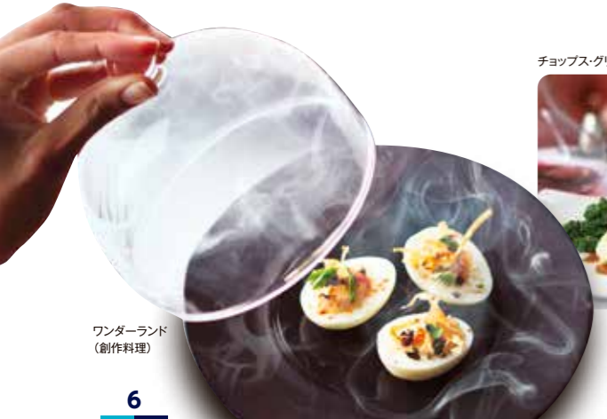
ワンダーランド (創作料理)

摩訶不思議な創作料理やロボットバーテンダーまで、個性的な飲食店がズラリ。 火鍋、鉄板焼き、四川料理など、アジアフードも多彩にご用意しています。