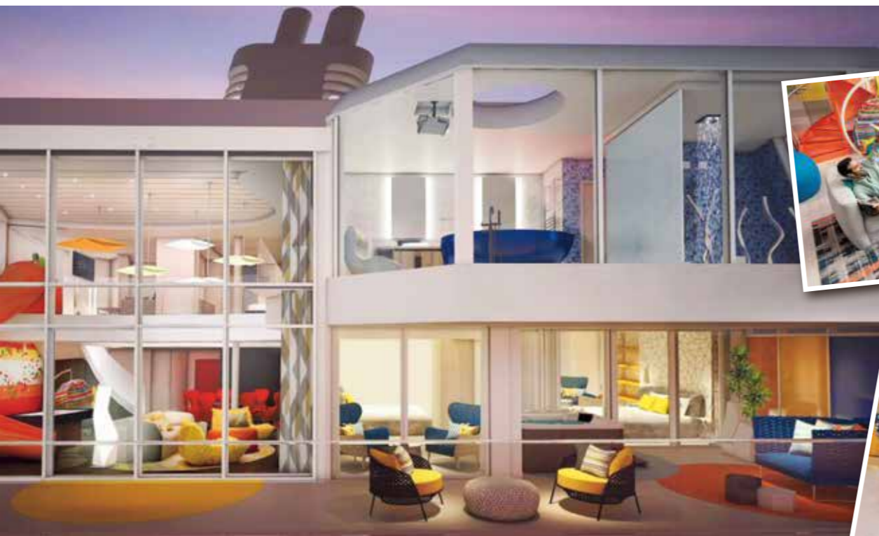
アルティメットファミリースイート