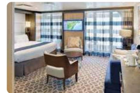
ジュニアスイート