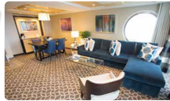
オーナーズスイート