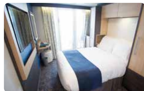
スタジオ・バルコニー