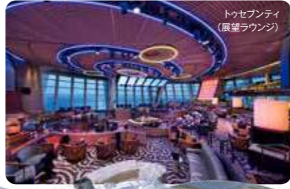
トゥセブンティ (展望ラウンジ)