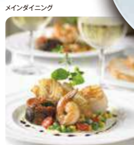
メインダイニング