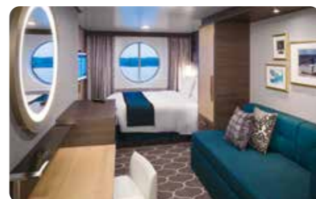
スタンダード海側