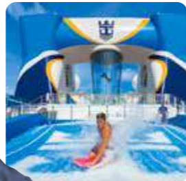
フローライダー (サーフィン)