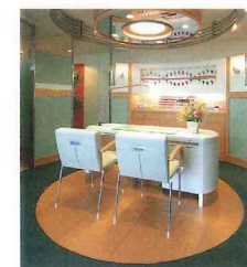
ネイルアート&ケア