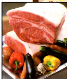
ステーキバイキング(イメージ)