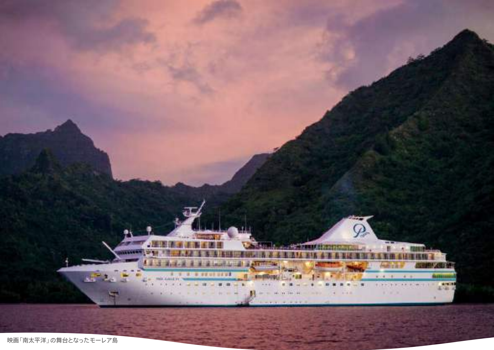
映画「南太平洋」の舞台となったモーレア島