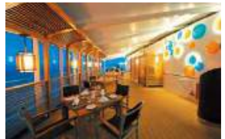
ル・グリル [朝食] [昼食] [夕食・要予約]

ディナーのためだけにオープンするこの優雅なメインダイニング「レトワール」では、美しく施された内装、そして魅惑的なスペシャリテをもって五感を満たします。メニューは日替わりで、無料のワインとのペアリングもお楽しみください。※予約不要のオープンシーティングのレストランです。