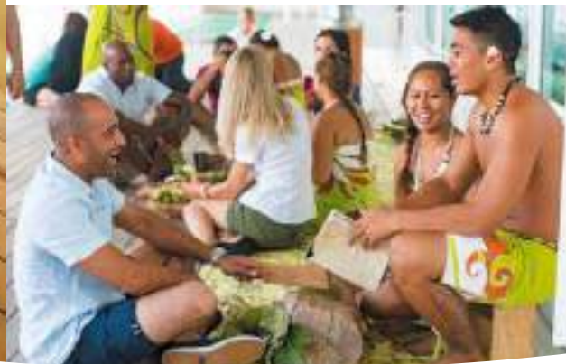
「レ・ゴギンズ」との触れ合いも貴重な体験

そして船の外はいつでも、暖かい青い海。心癒やされる光景とマリンスポーツが毎日楽しめます。