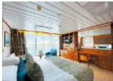
A ベランダ・スイート

客室は全室オーシャンビュー、ほとんどの客室がバスタブ付きでバスローブやスリッパ、アルゴテルムのアメニティも備えています。カテゴリ B 以上にはバトラーサービスが付きまます。