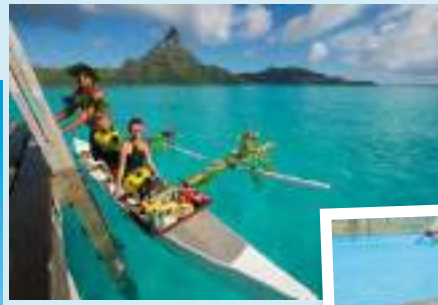
カヌー・ブレイクファースト (イメージ)