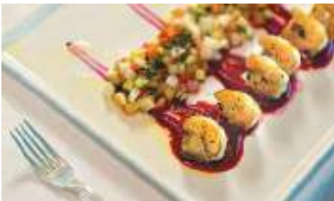
ラ・ベランダ [朝食] [昼食] [夕食・要予約]

オーシャンビューのお席や屋外デッキでのお食事を楽しめる「ラ・ベランダ」では、寄港地にインスピレーションを受けたアラカルトや、趣向を凝らしたビュッフェ(朝食・昼食)をご提供しております。ディナーは、パリの有名シェフ ジャン・ピエール・ヴィガト監修のグルメキューズをお堪能いただけるスペシャルティ・レストラン(予約制)となります。