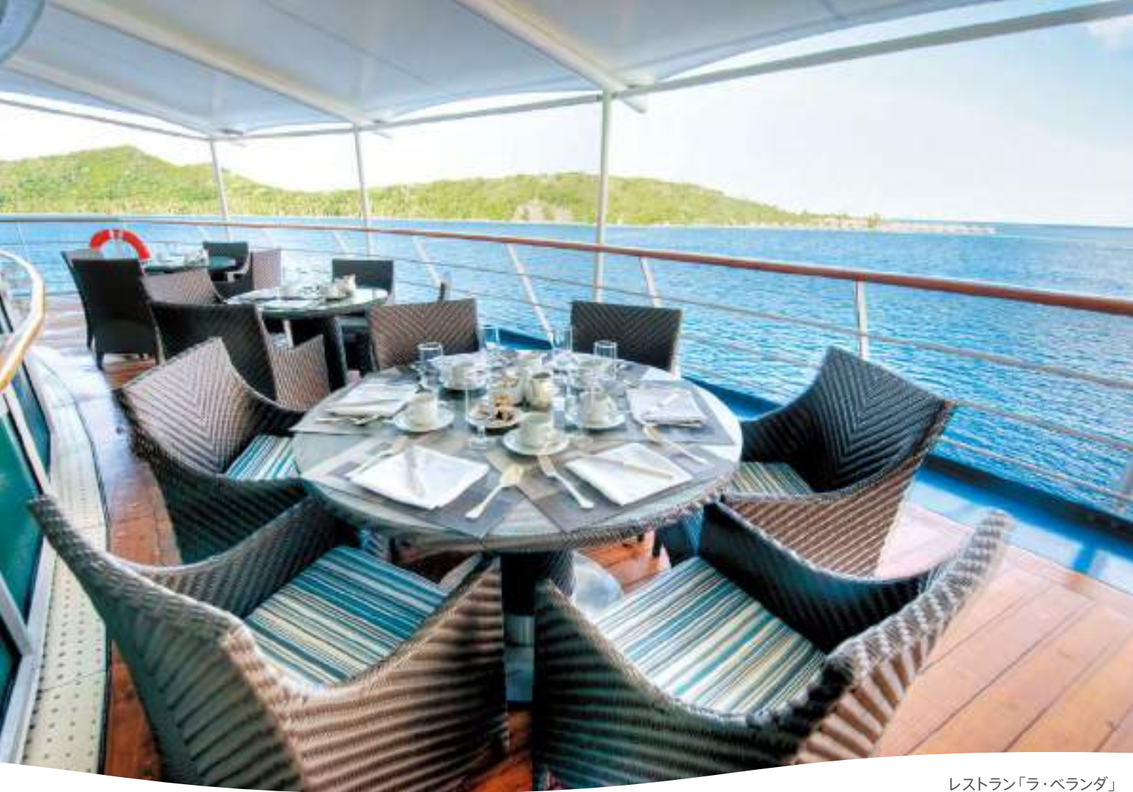
レストラン「ラ・ベランダ」