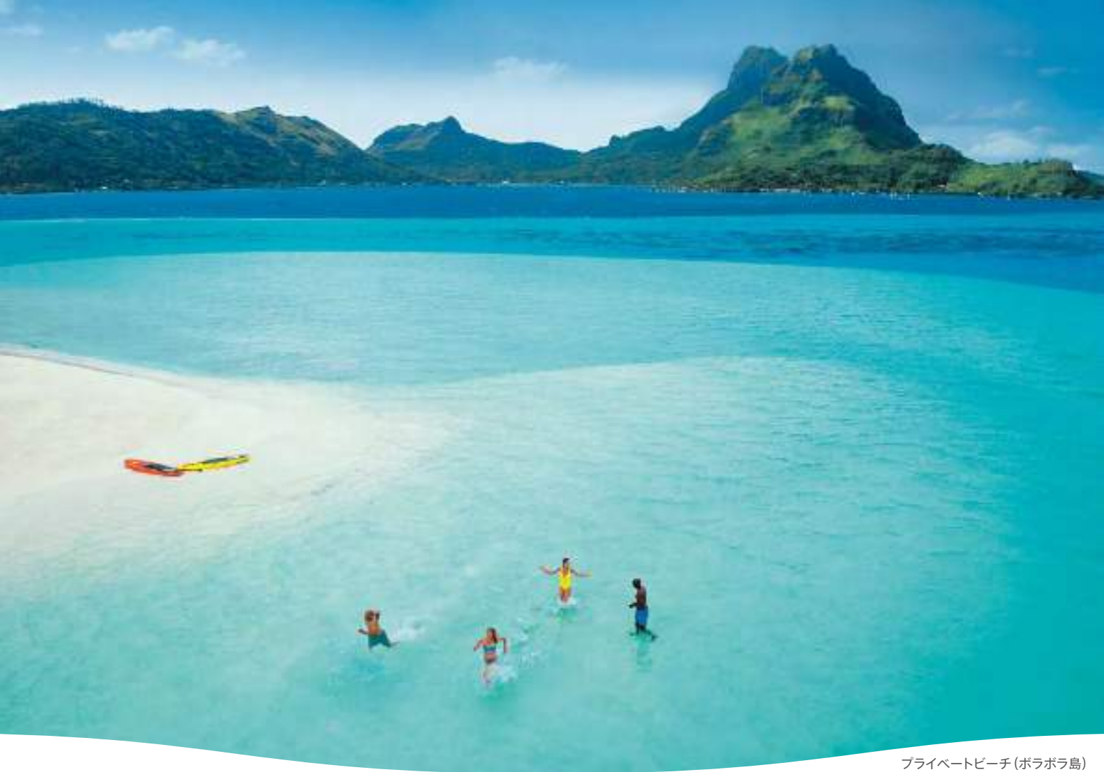
プライベートビーチ (ボラボラ島)