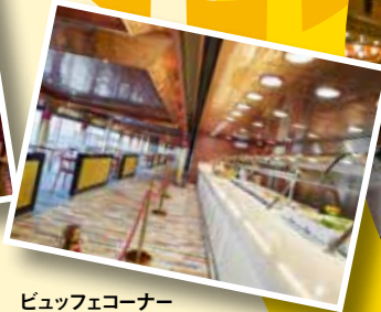
ビュッフェコーナー お好きな時間に自由に 気軽にお食事が出来ます。