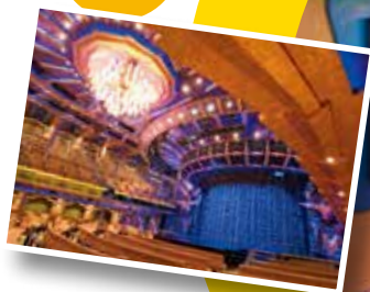
シアター 1,300名収容のシアターでは、 様々なエンターテイメントショーを 鑑賞出来ます。