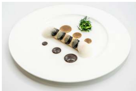
写真上：サクラ 写真下：アンソロジー、ホタテ貝のカネローニ