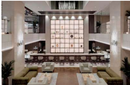
写真左：コンサバトリールプール(エクスプローラI,II)、写真右：ロビーバー(エクスプローラI,II)