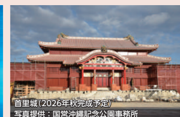
首里城(2026年秋完成予定)