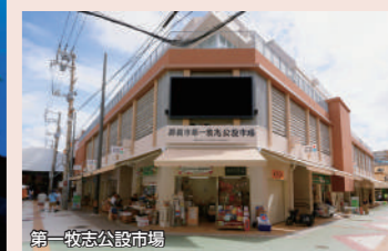
第一牧志公設市場